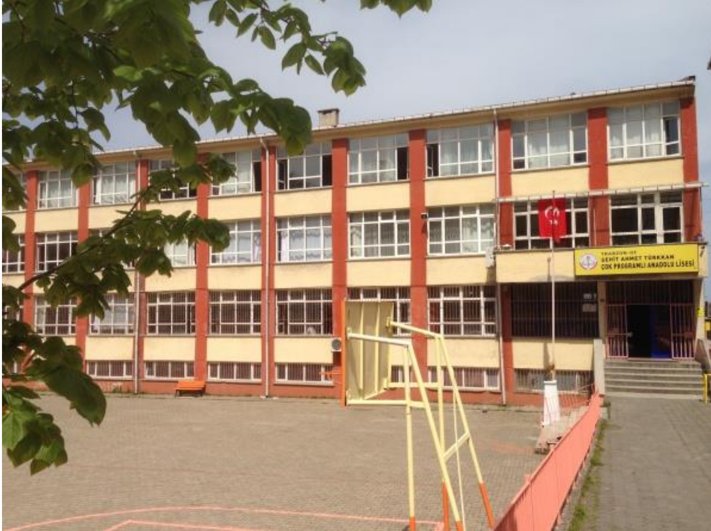
ŞEHİT AHMET TÜRKKAN ÇOK PROGRAMLI ANADOLU LİSESİ